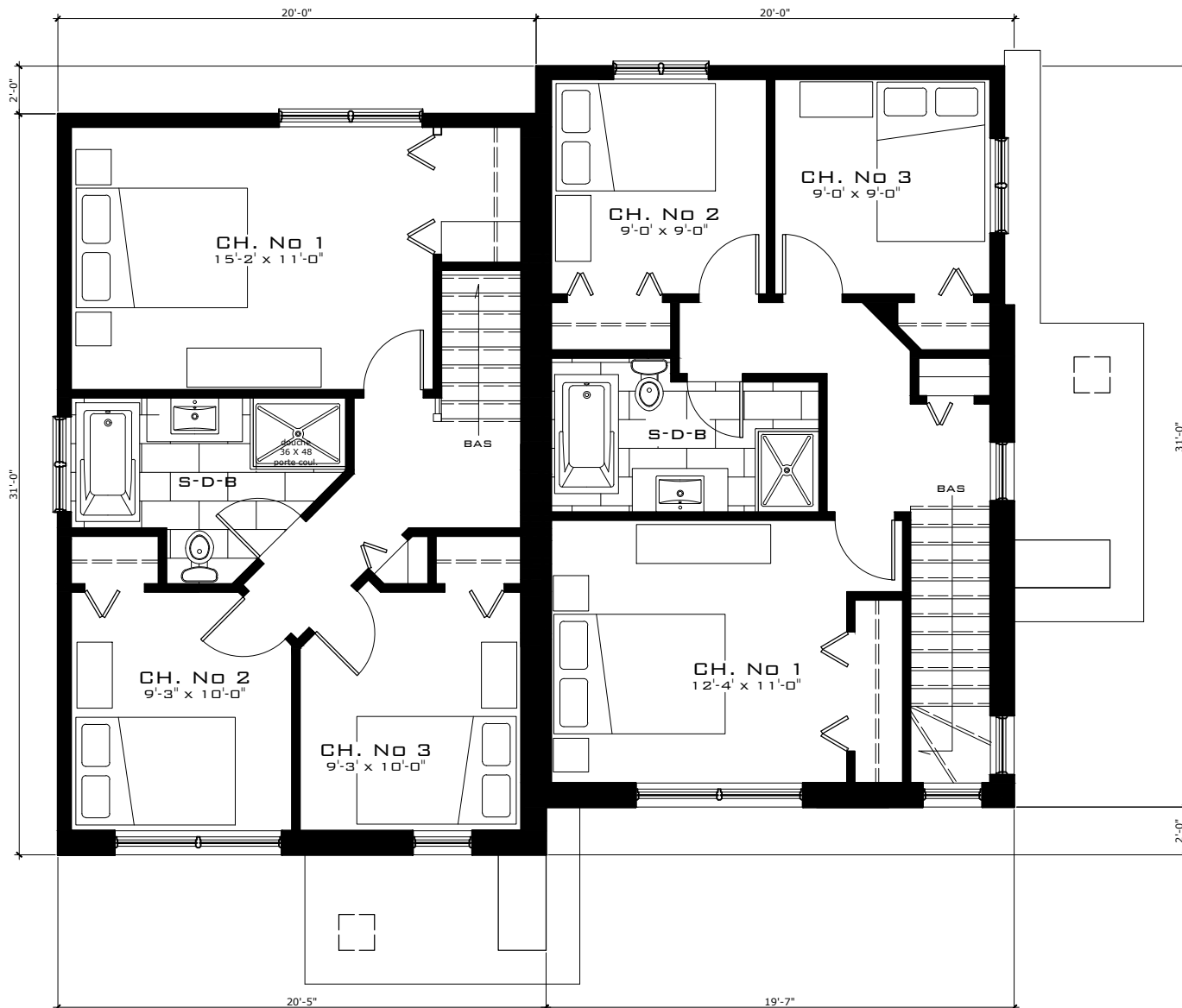
PLAN DE L'ÉTAGE OPTION 1 (MODELE 3 CHAMBRES) 620 P.I.CA